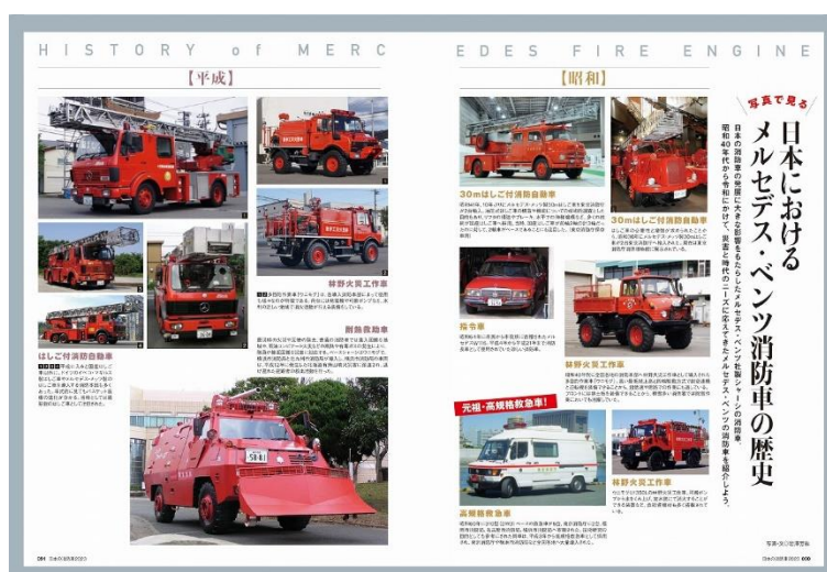
メルセデス・ベンツ消防車の歴史。