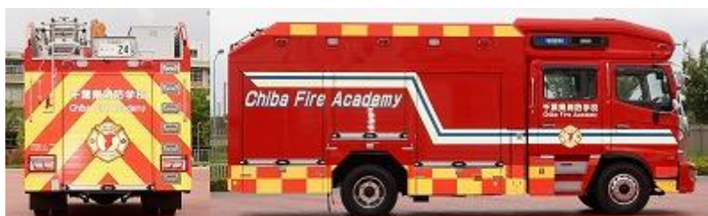
再帰性に富んだ反射材により、昼夜の被視認性を高め、緊急走行と現場活動の安全性を図っている。