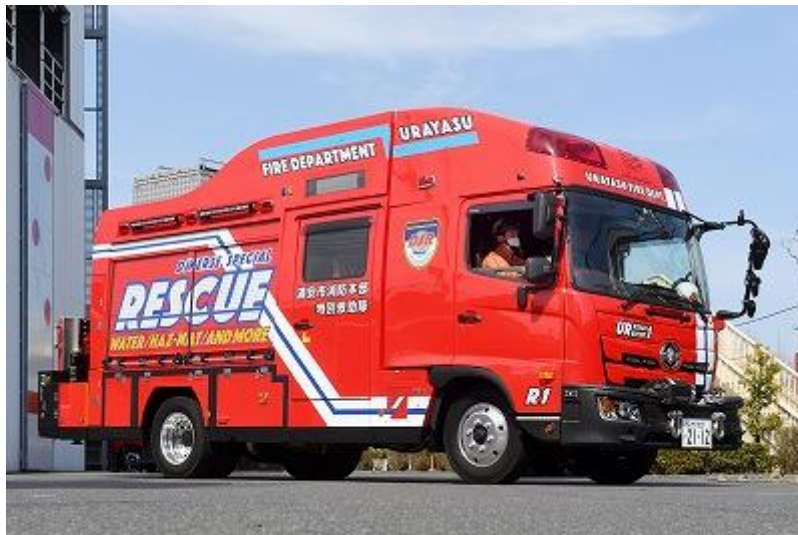
キャブ内の空間が拡大された「バス型」という次世代型・救助工作車。

また特別企画として、「メルセデス・ベンツ消防車の歴史」や、街で見かける「働くクルマ」の特装メーカー探訪レポートも特集しております。今年も内容の充実した一冊を是非お楽しみください。